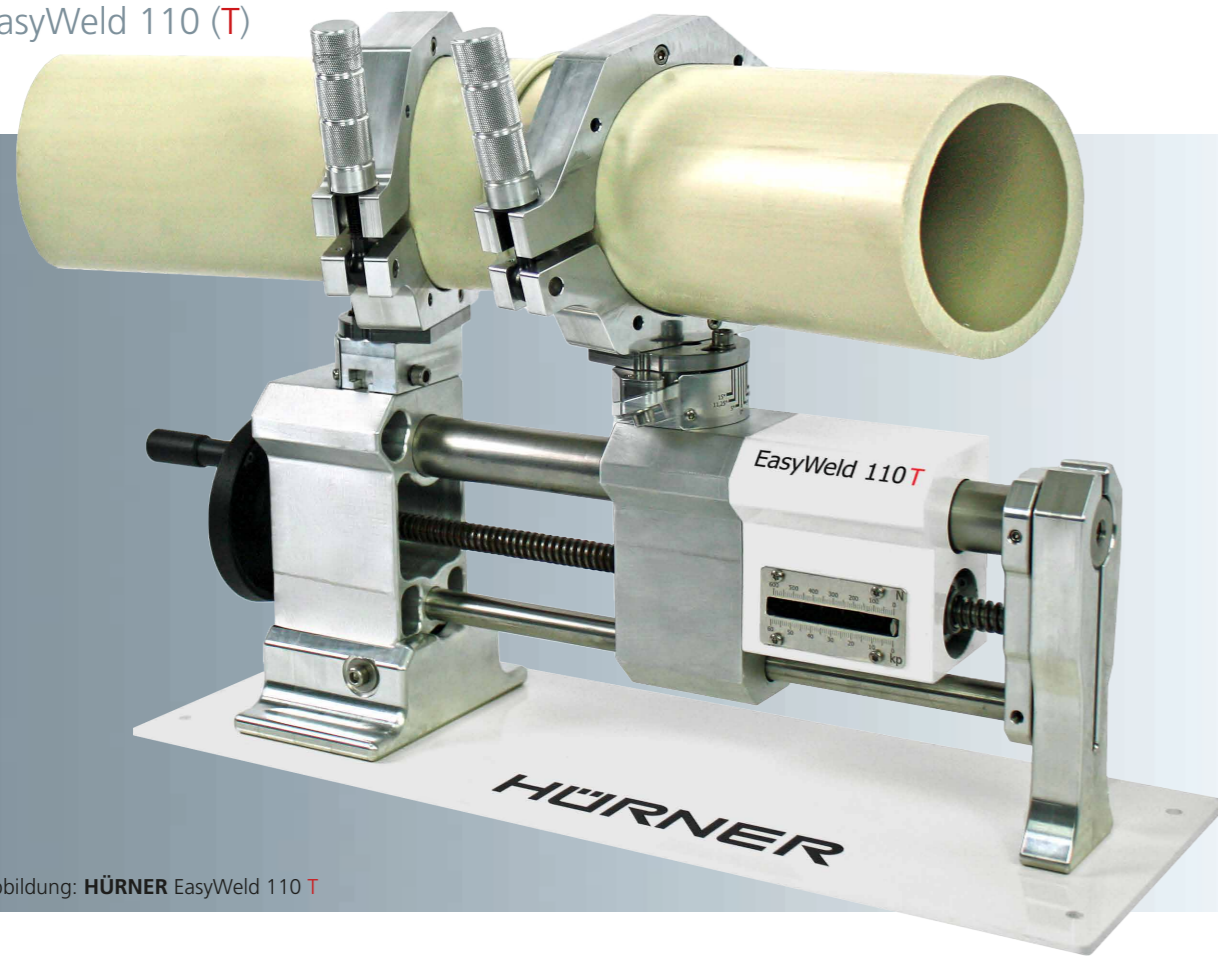
Abbildung: HÜRNER EasyWeld 110 T